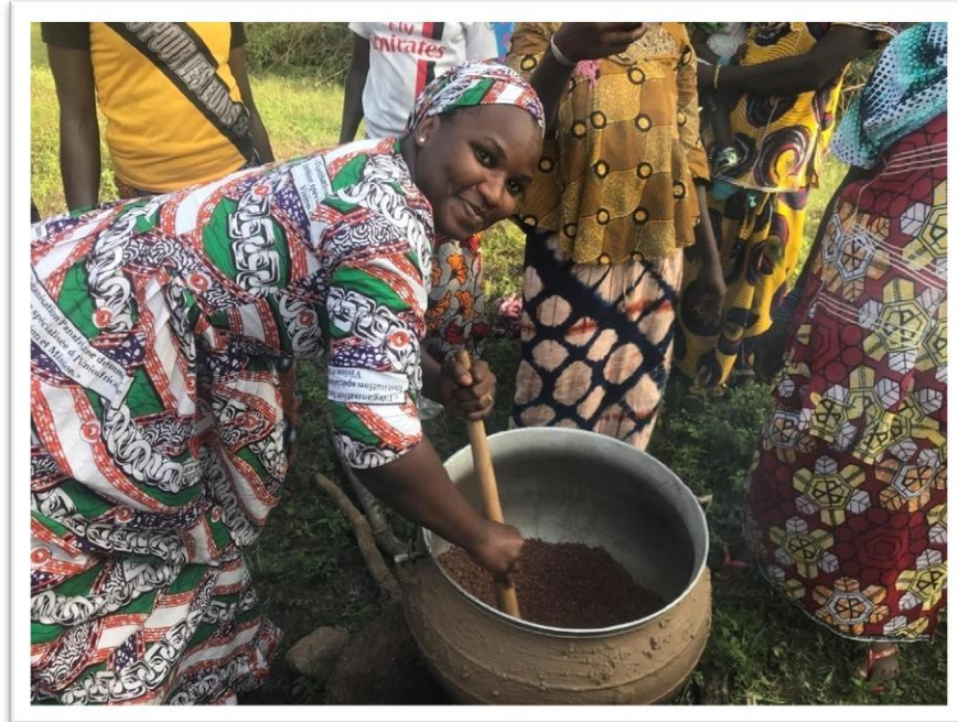
Membre de la coopérative du village de Kai qui fabrique du beurre de Karité.

Ce sont 18 % des fonds alloués en 2018 qui contribuent au renforcement des organisations et leur permettent d'améliorer leur gestion et leur fonctionnement.