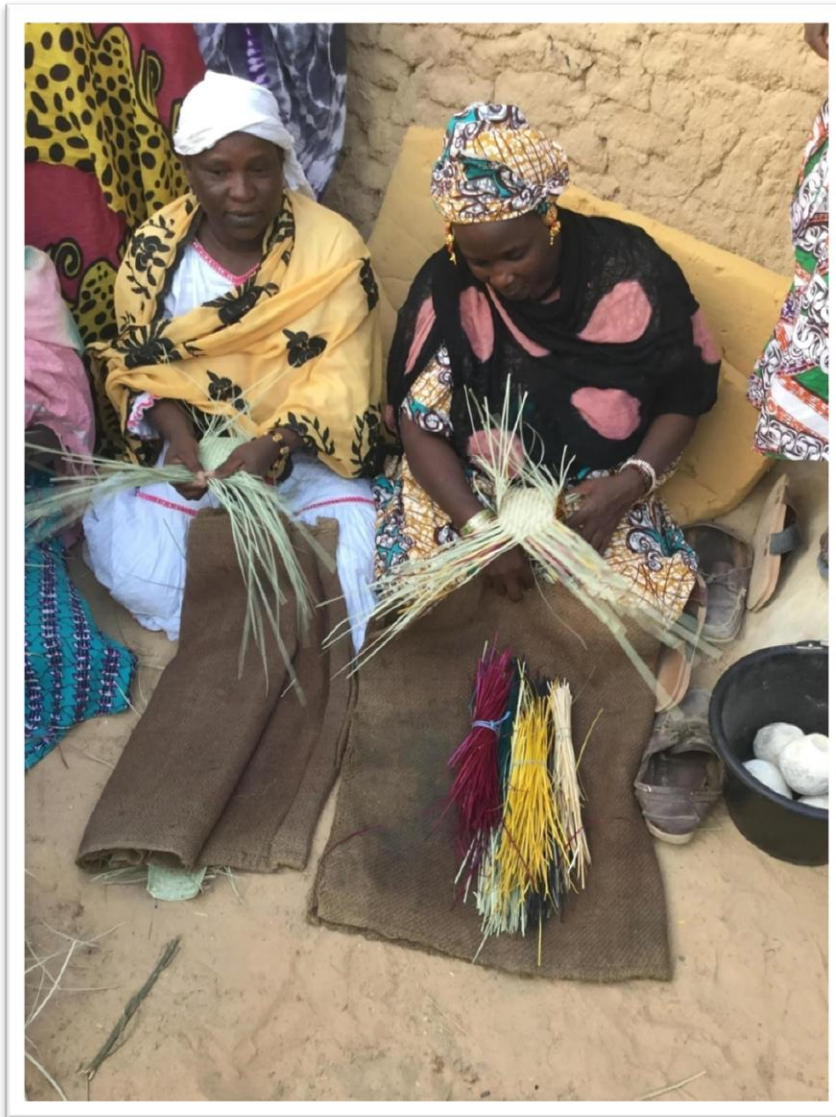
Membres du groupe des artisanes du village d'Iloa près de Tombouctou, au bord du fleuve Niger, fabriquant des nattes en pailles colorées.

Ce sont 90 % des montants recueillis qui sont alloués aux organisations de femmes, 10 % contribuant aux frais de gestion du CECI. Ainsi 233 100 $ , dont 53 100 $ en début 2018, ont été alloués à 25 associations regroupant près de 1 190 femmes. Ces associations sont des coopératives et des groupements à statut divers, situées dans les quartiers pauvres de Bamako, dans des régions comme Tombouctou et Kayes au nord du pays ainsi que Sikasso. Elles ont pour objectif d'améliorer les conditions de vie de leurs membres.