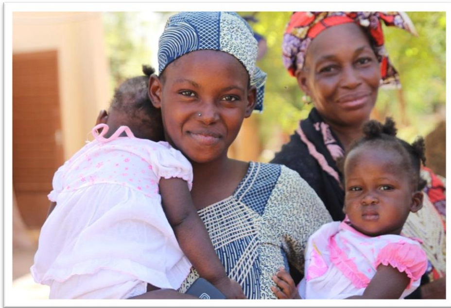
Les femmes et leurs enfants au centre de santé de Yrimadjo, quartier pauvre de Bamako

Ce bilan a pour objectif d'informer les donateurs et les donatrices du Fonds Armande Bégin du CECI (Centre d'étude et de coopération internationale) sur les montants recueillis, l'allocation des fonds et les résultats obtenus en 2017.