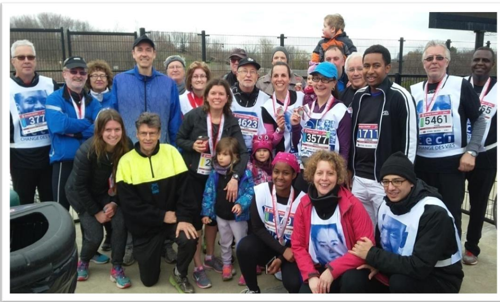
Photo 1. Une partie des participant-e-s au Défi caritatif de la banque Scotia en 2017

Plusieurs activités de collecte de fonds sont organisées par la famille et les ami-e-s d'Armande. Le CECI participe chaque année à la course du Défi caritatif de la Banque Scotia où le Fonds Armande Bégin a sa propre équipe. Les participant-e-s marchent ou courent 5K, 10K ou 21K et sollicitent des dons en argent auprès des membres de leur entourage. En 2017, près de 40 personnes ont participé au défi et on s'attend à une participation en hausse les 21 et 22 avril 2018. Le Fonds a bénéficié aussi de dons in memoriam et d'un don testamentaire.