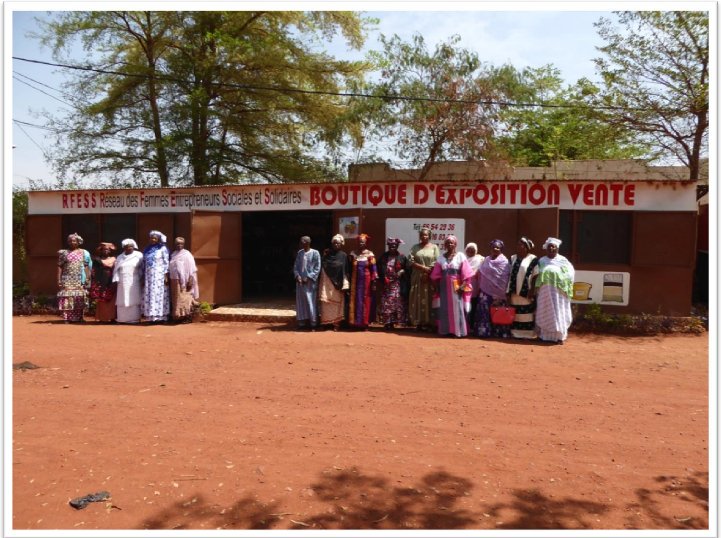
Les membres de la coopérative des femmes d'économie sociale et solidaire devant leur magasin de vente de produits agroalimentaires transformés.