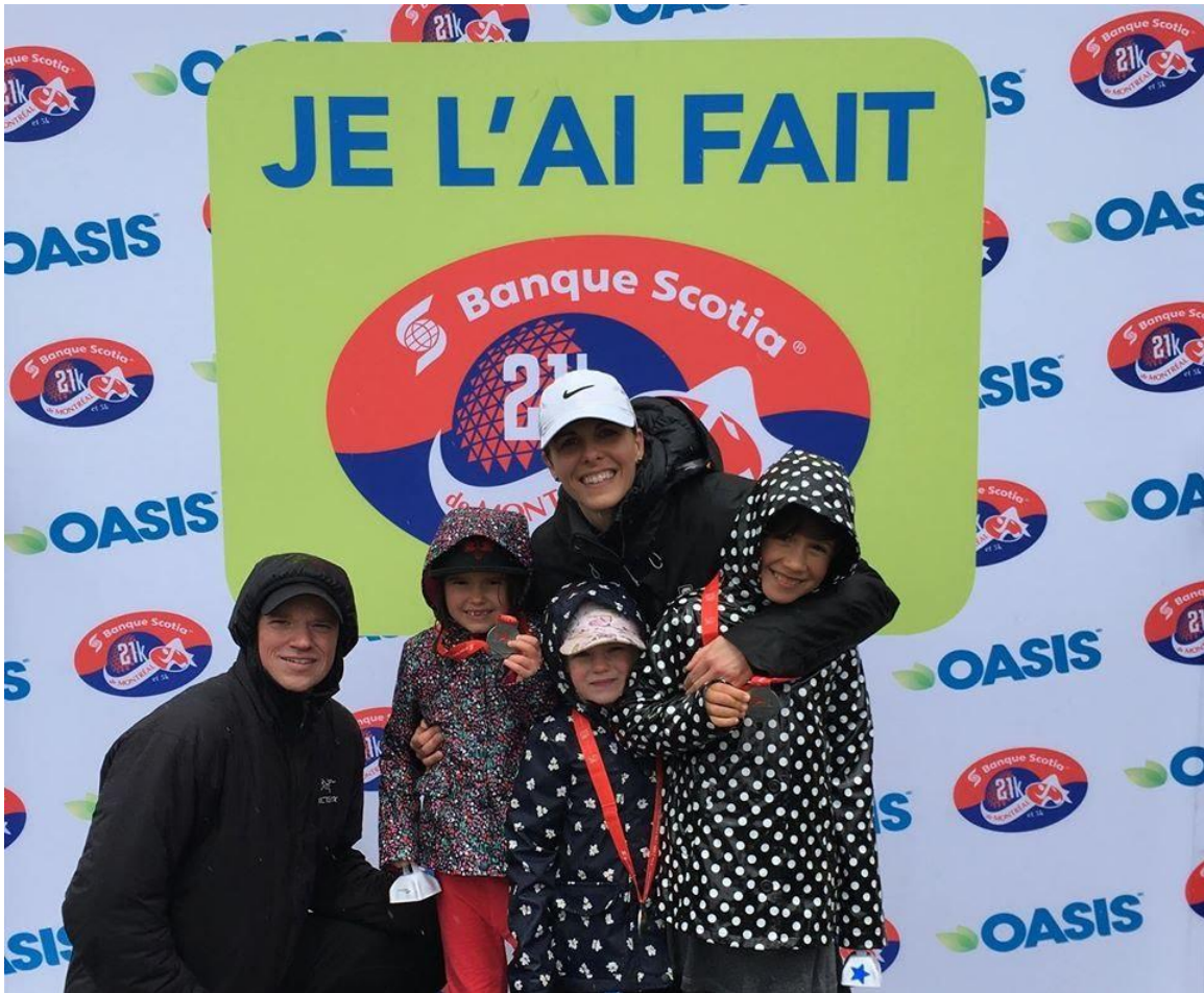
Parents et enfants unis pour le Fonds Armande Bégin sous la pluie au Défi Scotia 2019