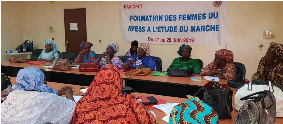
Session de formation pour les membres du Réseau des femmes entrepreneures sociales et solidaires.