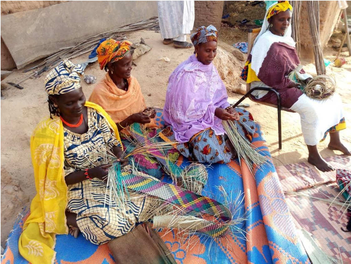
Artisanes de l'association des femmes d'un village près de Tombouctou qui fabriquent des nattes et qui bénéficient de microcrédits de la part du Fonds Armande Bégin.