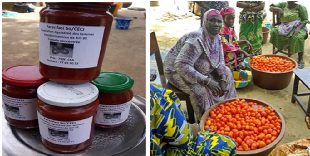
Membres de l'association Faranfasi de villages au centre du Mali, productrices et transformatrices de tomates.

Quelque 18 % des fonds alloués au début de l'année 2020 ont été octroyés pour investir dans les infrastructures et les différents intrants, tels que les broyeurs pour la transformation de tomates, le matériel pour la fabrication de savon, les moulins à grains, etc. Chaque association de femmes reçoit une formation de base sur les comptes d'exploitation et l'amortissement. Ainsi, elles doivent prévoir des réserves pour la maintenance et le renouvellement des équipements, l'octroi d'un don pour investissement n'ayant lieu qu'une seule fois pour démarrer.