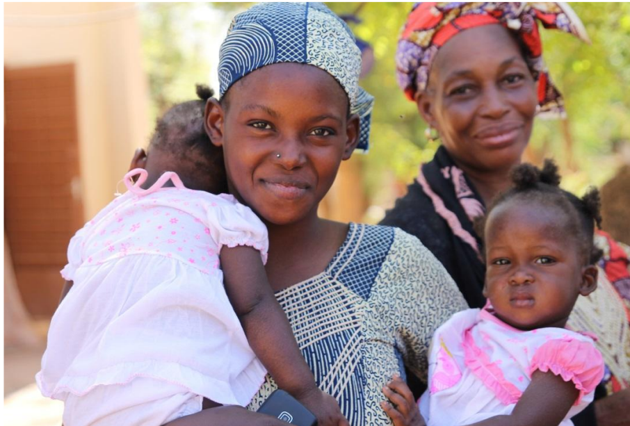
Les femmes et leurs enfants au centre de santé de Yrimadjo, quartier pauvre de Bamako

Ce bilan a pour objectif d'informer les donatrices et les donateurs du Fonds Armande Bégin pour la promotion des femmes au Mali du CECI (Centre d'étude et de coopération internationale) sur les montants recueillis, les résultats obtenus en 2019 et l'allocation des fonds au début de l'année 2020.