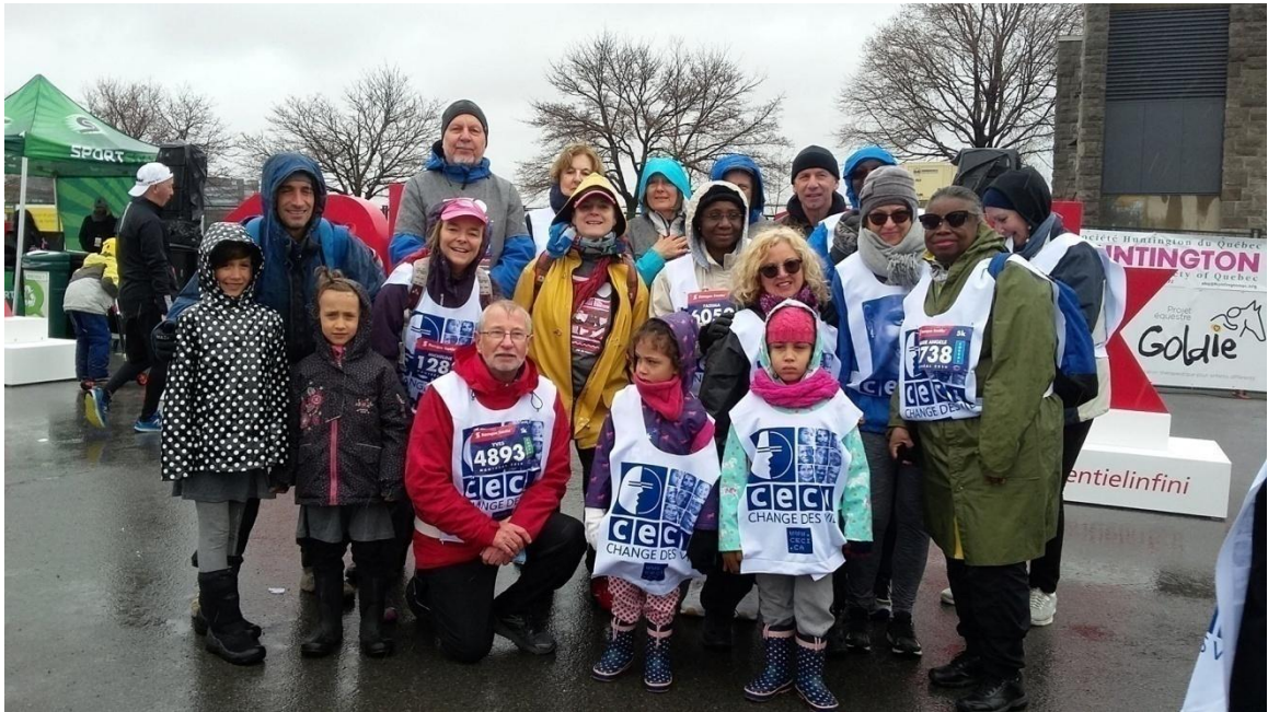
Une partie des participant-e-s au Défi Scotia en 2019 qui s'est déroulée sous la pluie

Nous voulons souligner deux initiatives particulières en 2019: (1) la donation de 6 630 $ des paroisses Saint-Thomas-d'Aquin et Saint-Lambert grâce aux contributions de paroissiens à l'occasion du "carême du partage"; (2) le geste d'un couple de nouveaux mariés qui ont suggéré aux invités à leur mariage de faire des dons au Fonds Armande Bégin en guise de cadeaux de mariage, ce qui a généré 2 050 $.