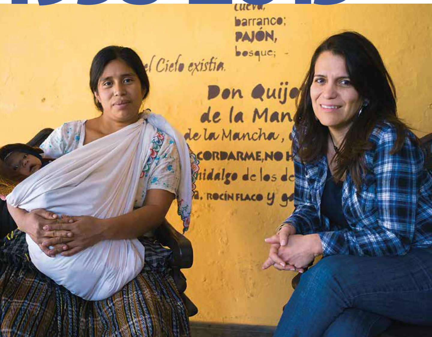
GUATEMALA BOLIVIE